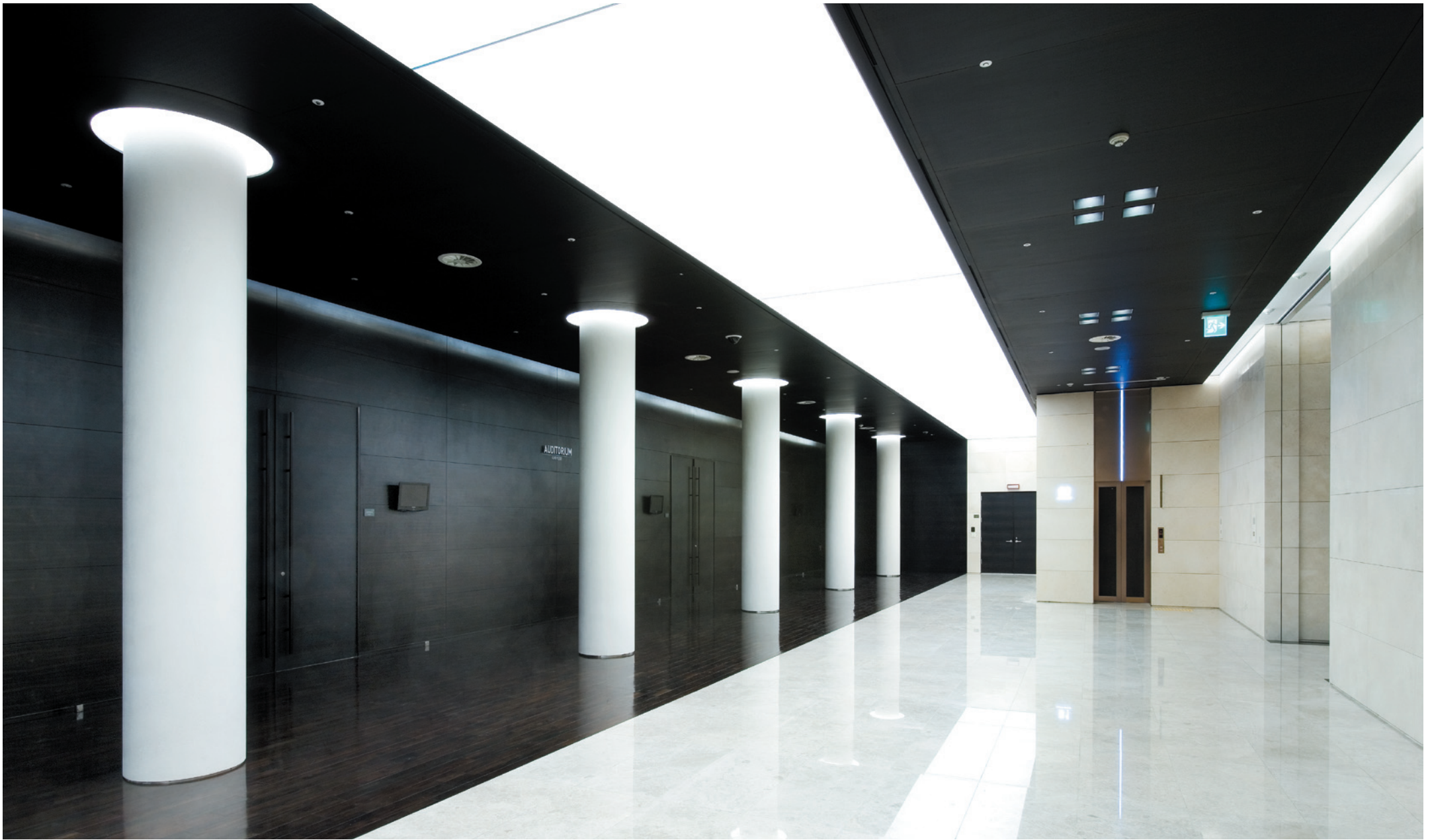
018. 지하 1층 다목적 홀 로비. 전이공간(회랑), 기억의 공간(열주)의 의미를 부여하며 매개체로서의 리듬성을 살린 공간이다.