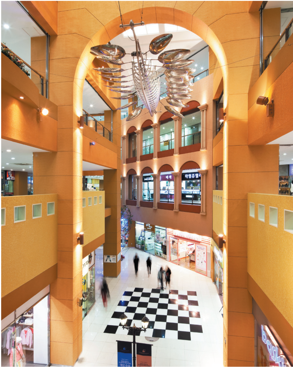
039. void no. 3. 따뜻한 컬러의 variation이 공간을 더욱 더 풍성하게 하며, 체스 패턴은 고객의 다양한 상상과 행동을 유발한다.