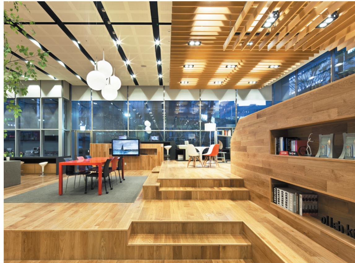
007. 008. 1층 로비.