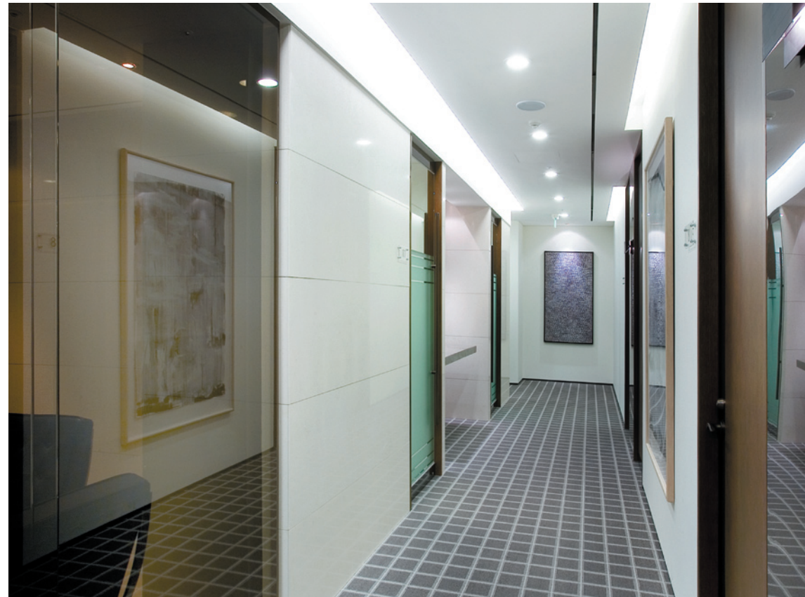
034. 3층 리셉션.