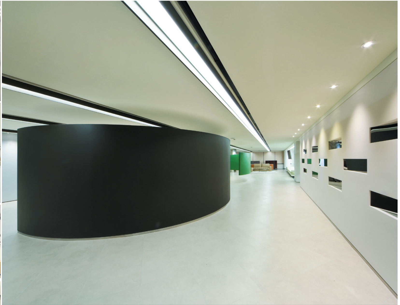
028. 1층 로비 및 엘리베이터 홀. 'I want to go there' 다이나믹한 형태, 자재 및 조명 등을 통해 회사의 전체 아이덴티티를 부여하는 공간이다.